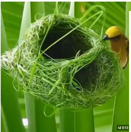
Птицы - они прежде всего инженеры, а потом уже всё остальное!

Рубрика "Познавайка" (4+) Вы думаете, что птицы они кто? Птицы - это прежде всего инженеры!!! Наблюдаем за тем, как птичка строит дом. Тсс... не спугни!