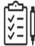
СТРУКТУРА ОБРАЗОВАТЕЛЬНОЙ ПРОГРАММЫ