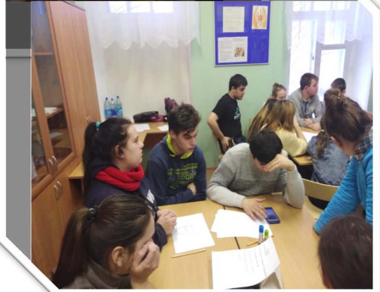
Мероприятие «Помоги себе сам» оказание первой (доврачебной) помощи