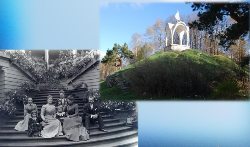
Загородная усадьба Михалковых «Петровское»