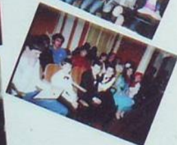
Выставка в Доме офицеров