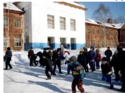
МОУ Чебаковская СШ