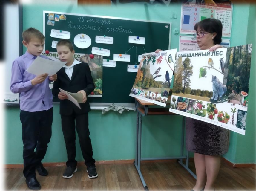
Проектикоориентированные семинары на базе Павловской ОШ, Чебаковской СШ