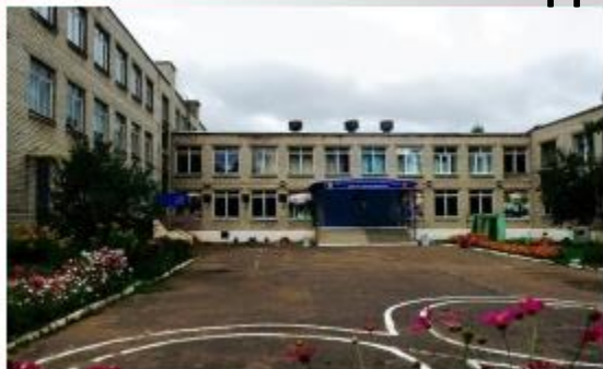
МОУ СШ №4 «Центр образования»