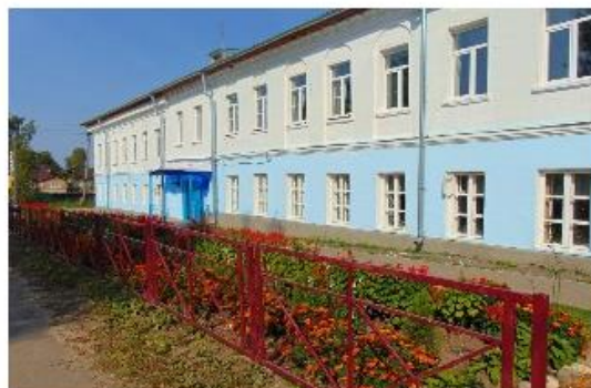
МОУ Левобережная школа г. Тутаев