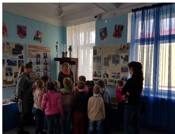
Посещение экспозиции музея «Знаменитые спортсмены г. Рыбинска»