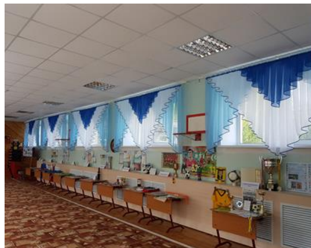
Создание выставки «Спортивные достижения воспитанников»