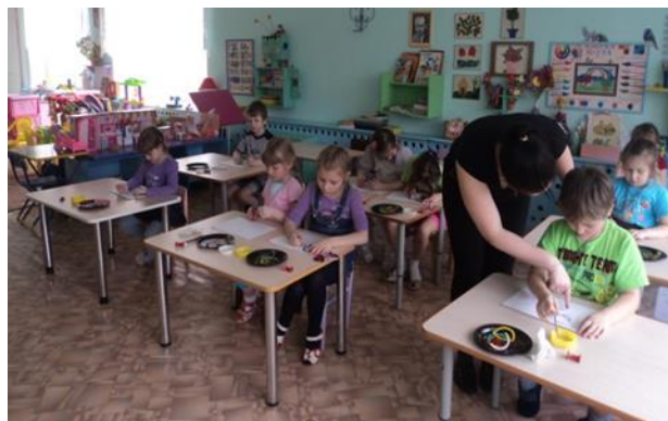
Продуктивная деятельность «Овощи и фрукты – полезные продукты»