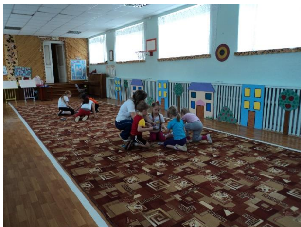
Физкультурное занятие «Азбука дыхания»