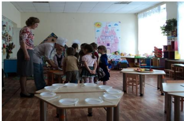
Познавательная деятельность «Советы доктора Айболита»