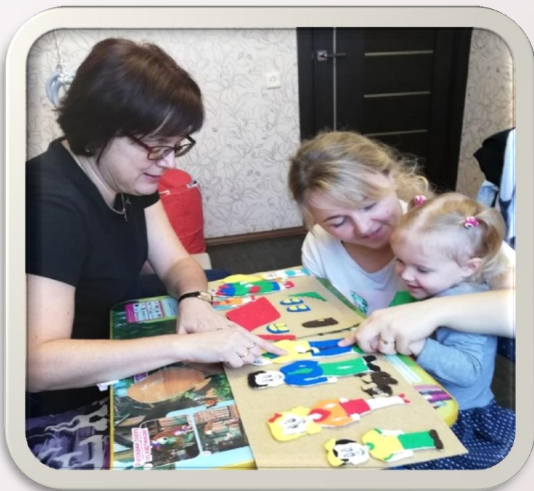
Работа над слоговой структурой слова