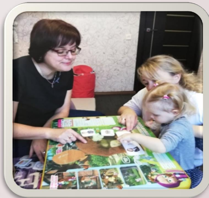
Работа над фразой