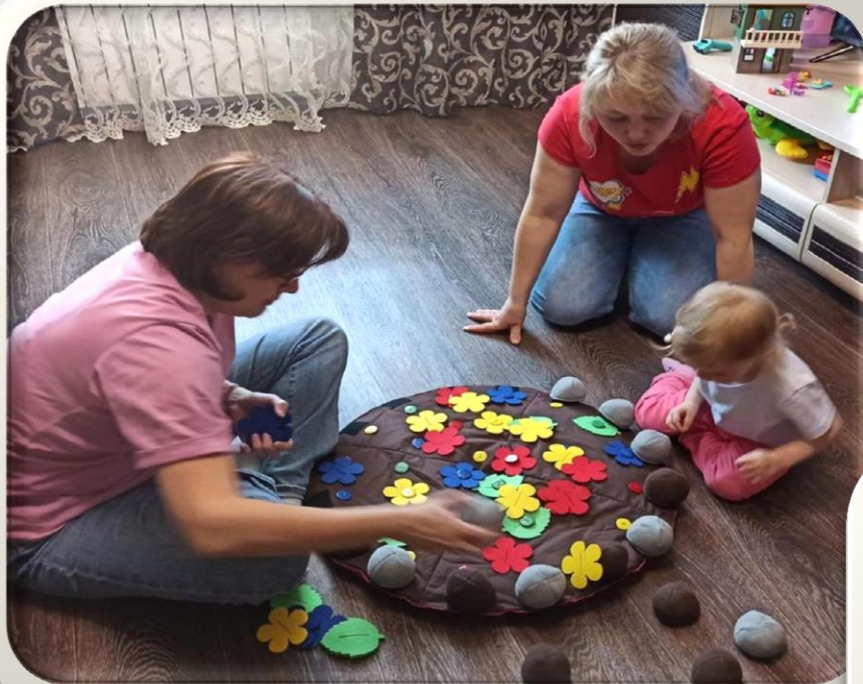
учитель - логопед