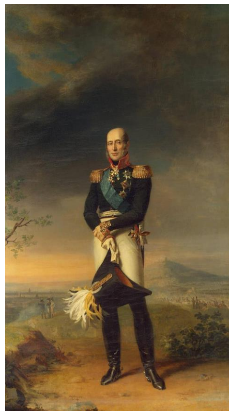
Михаил Богданович Барклай-де-Толли. Художник Д. Доу, 1829

О вождь несчастливый! Суров был жребий твой: Все в жертву ты принес земле тебе чужой. Непроницаемый для взгляда черни дикой, В молчанье шел один ты с мыслию великой, И, в имени твоём звук чуждый невзлюбя, Своими криками преследуя тебя, Народ, таинственно спасаемый тобою, Ругался над твоей священной сединою. И тот, чей острый ум тебя и постигал, В угоду им тебя лукаво порицал... И долго, укреплен могущим убежденьем, Ты был неколебим пред общим заблужденьем;