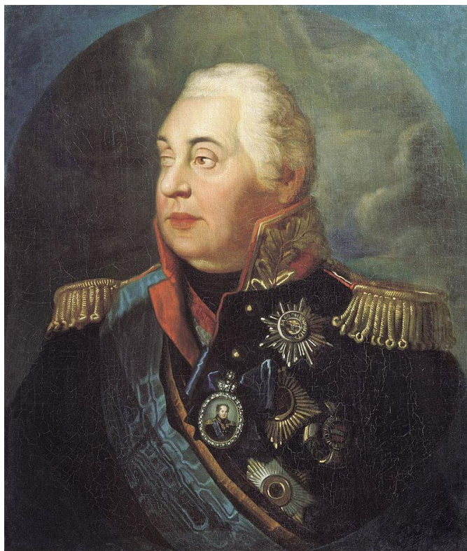
Волков Р. М. Портрет М. И. Кутузова, между 1812 и 1830 гг.