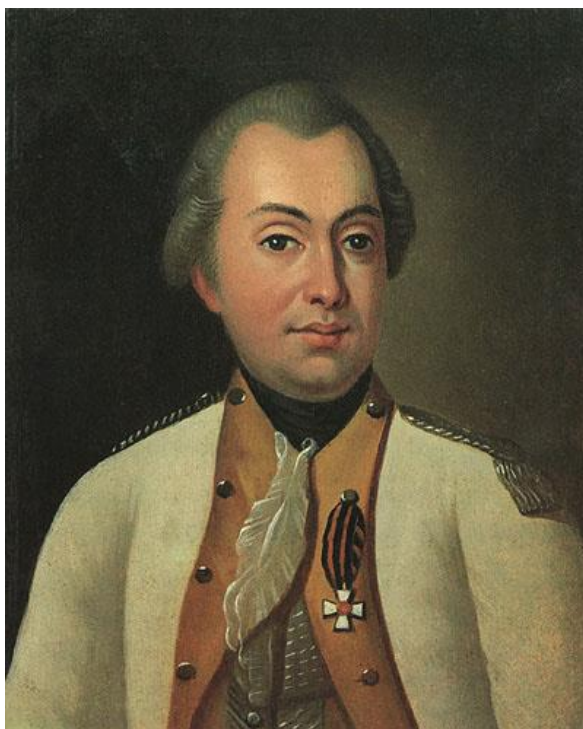
Портрет М. И. Кутузова в мундире полковника Луганского пикинёрного полка. 1777 г.