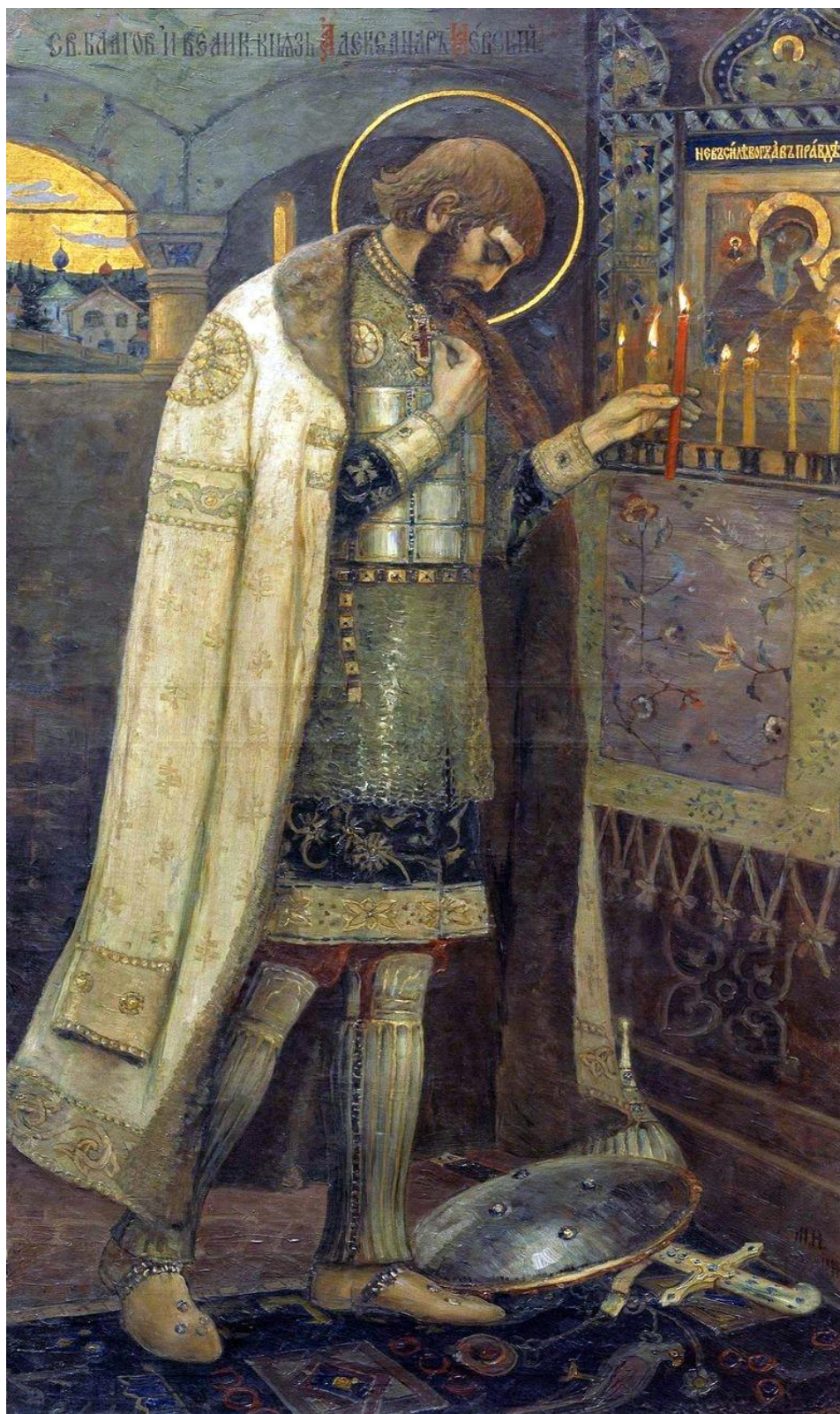
М. Нестеров Александр Невский

Крестовые походы оказали серьёзное влияние на историю восточно-европейских государств. Крестовые походы раздвинули горизонты географических и этнографических представлений западноевропейцев. Связи корабельщиков и купцов, феодальных сеньоров и рыцарей с Востоком и Византией принес-