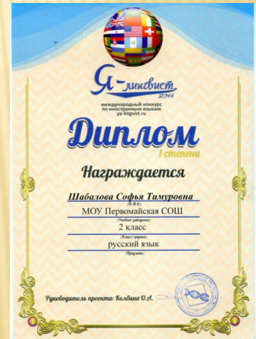
Международный конкурс по иностранным языкам «Я – лингвист»