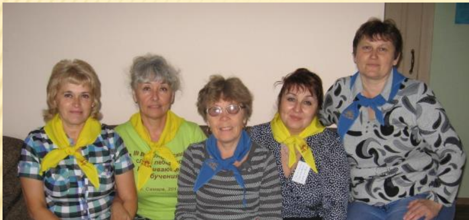
Команда Ярославской области