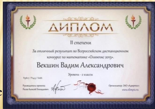
Всероссийский дистанционный конкурс «Олимпис – 2015»