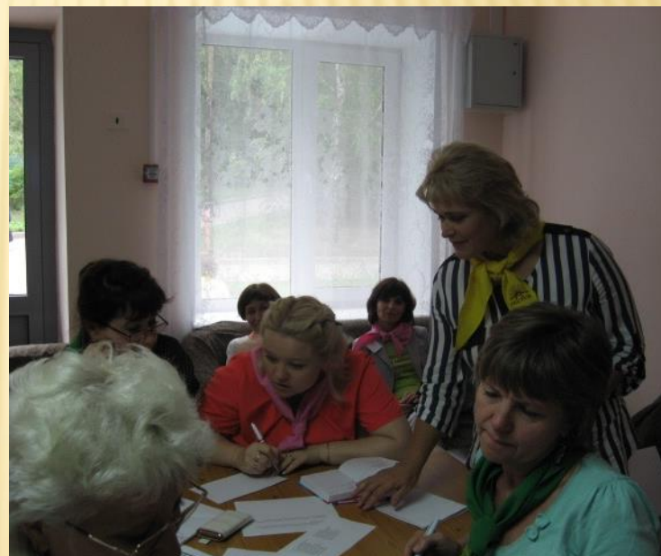
Мастер-класс «У природы нет плохой погоды...»