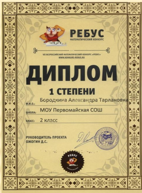
VII Всероссийский математический конкурс «Ребус»