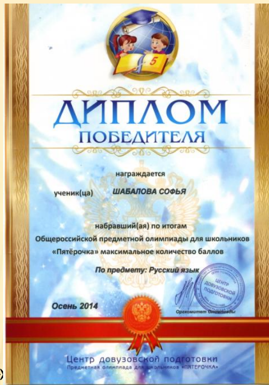
Общероссийская предметная олимпиада «Пятёрочка»