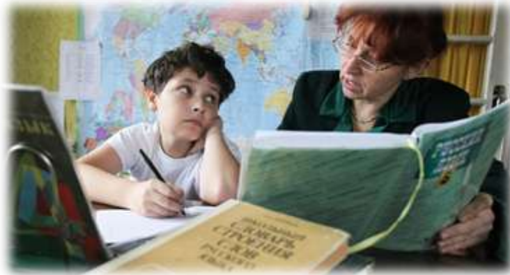
schools with a complex multicultural context