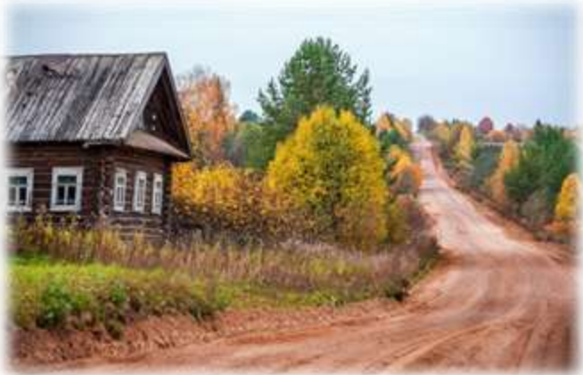
deprived rural schools