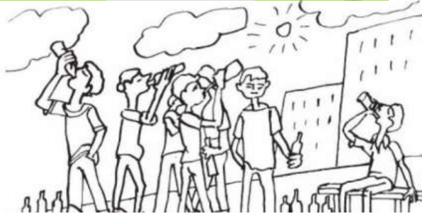
high level of deviation