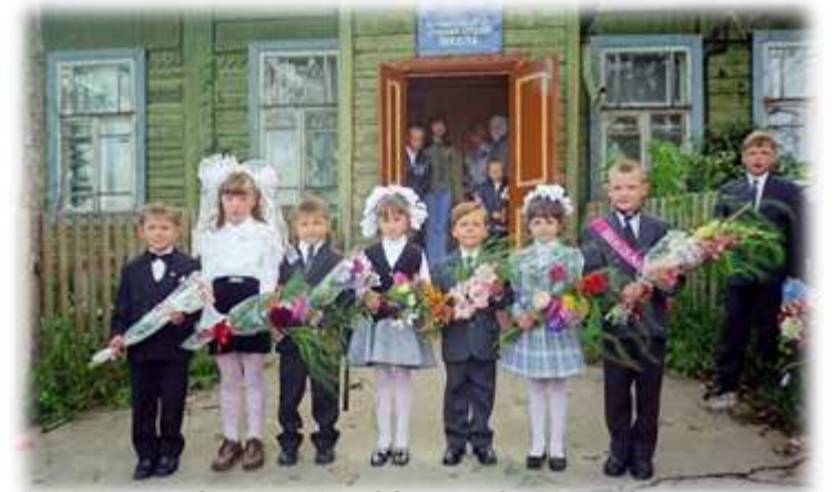
rural small schools