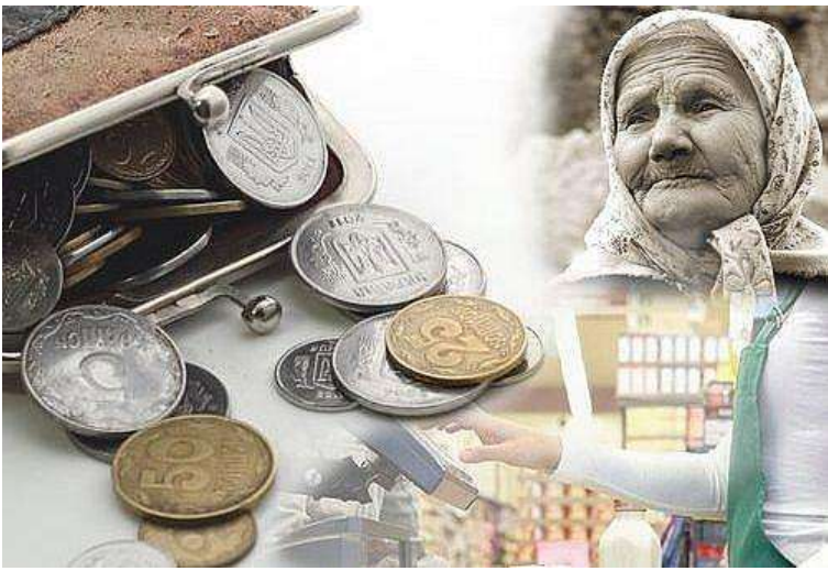
general social unhappiness