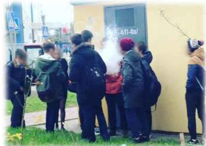
schools with a high level of deviance