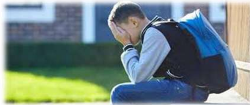
deprived urban schools