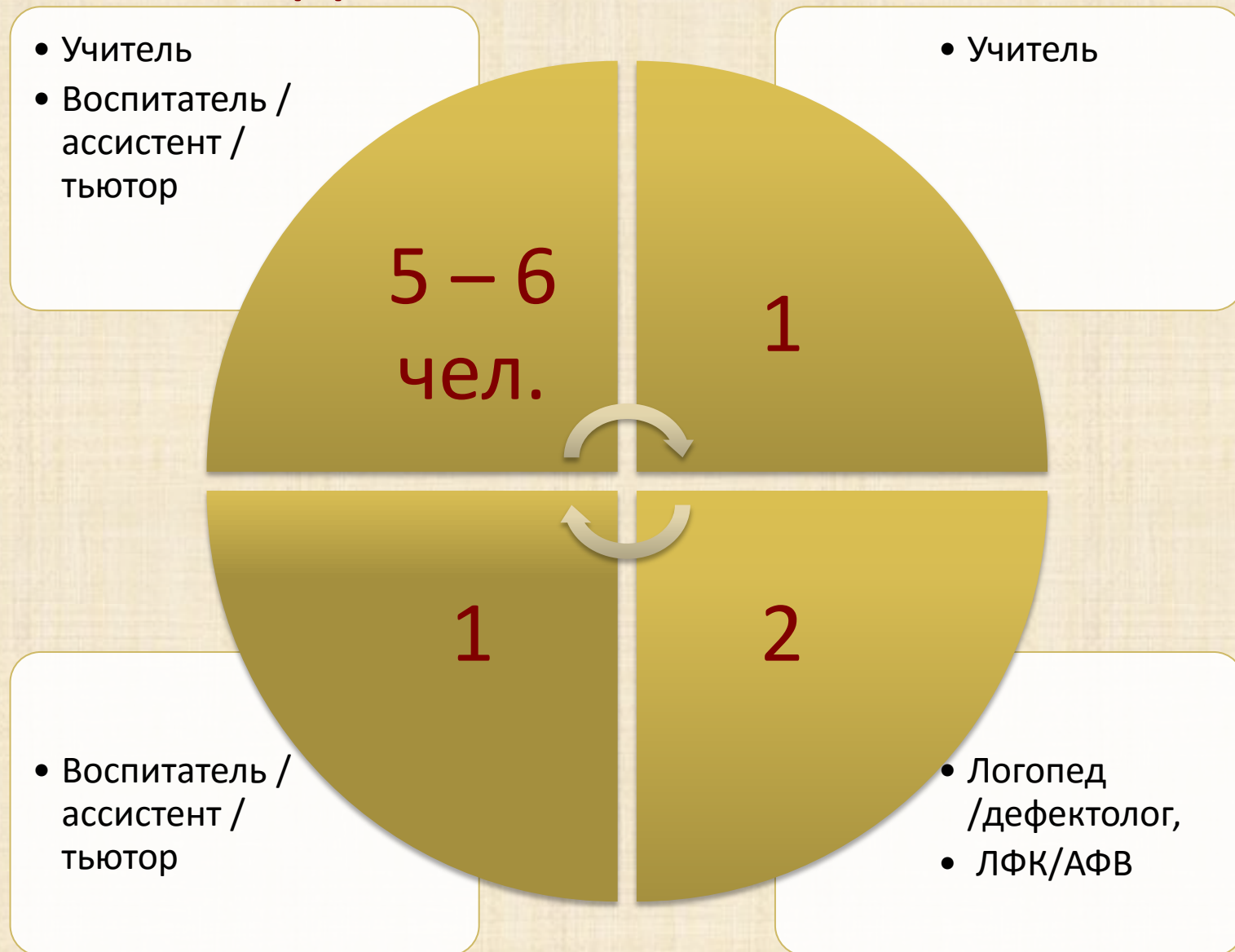
Схема возможного распределения детей 2-х классов