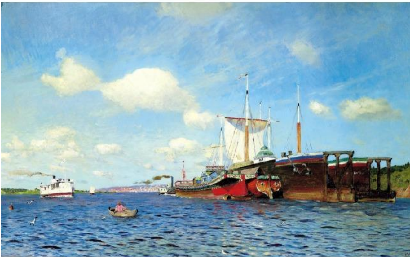
И. Левитан Свежий ветер