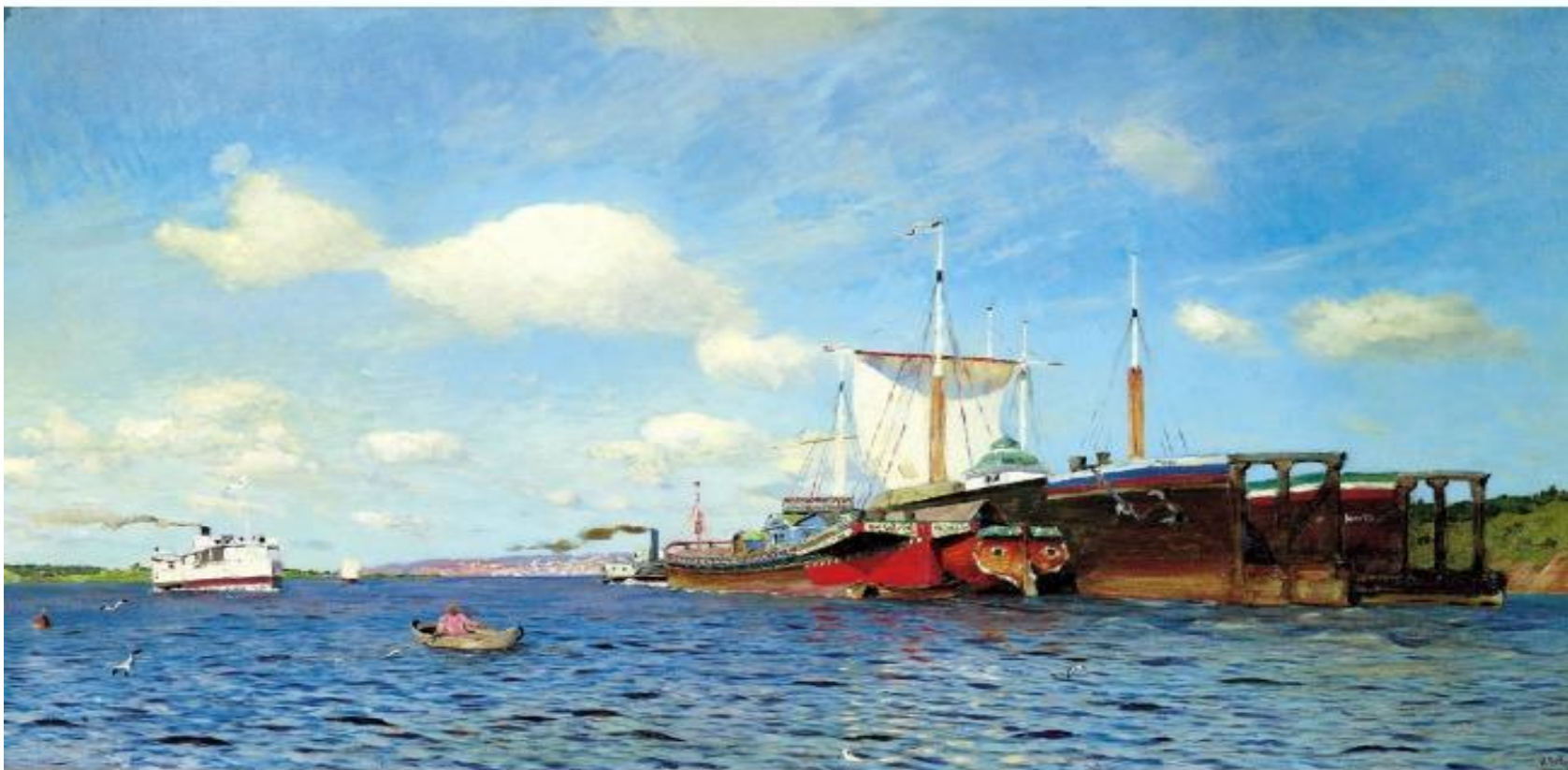
И. Левитан Свежий ветер