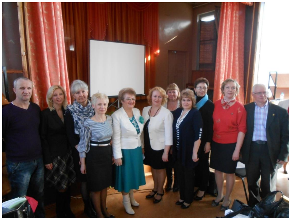
Межрегиональная конференция, Ярославль 2016