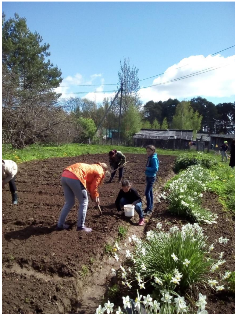
Работа на пришкольном участке, закладка опытов