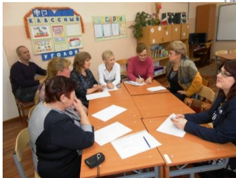
Региональный семинар, Кукобой 2016