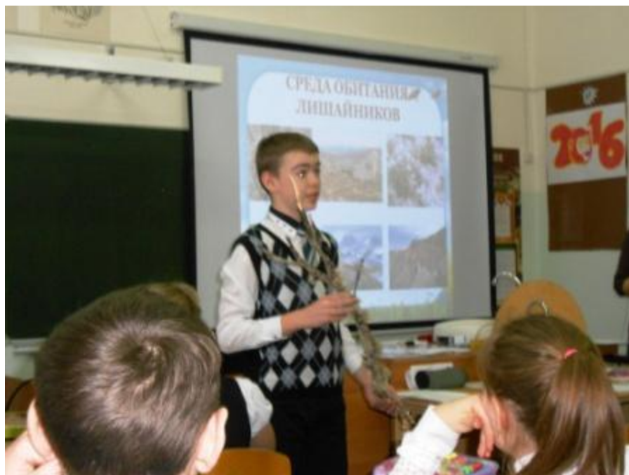
«Лишайники» Урок в 5,7 классах