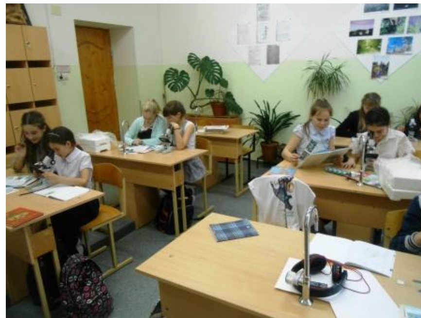
«Водоросли» Урок в 5,7 классах