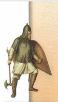
Русский пеший воин

Используя текст параграфа, подберите слова и составьте описание картины