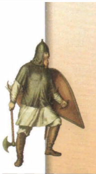
Русский пеший воин

В 1093 г. половцы совершили новый большой набег на Русь. С ними шёл сын Святослава Олег, правивший в далёкой Тмутаракани. Против них выступило объединённое войско киевского князя Святополка и сына Всеволода Вла-