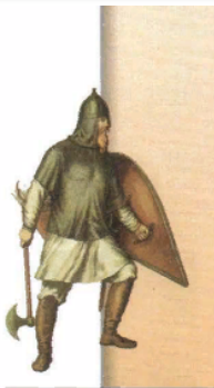
Русский пеший воин

В 1093 г. половцы совершили новый большой набег на Русь. С ними шёл сын Святослава Олег, правивший в далёкой Тмутаракани. Против них выступило объединённое войско киевского князя Святополка и сына Всеволода Вла-