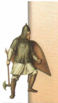
Русский пеший воин

В 1093 г. половцы совершили новый большой набег на Русь. С ними шёл сын Святослава Олег, правивший в далёкой Тмутаракани. Против них выступило объединённое войско киевского князя Святополка и сына Всеволода Вла-