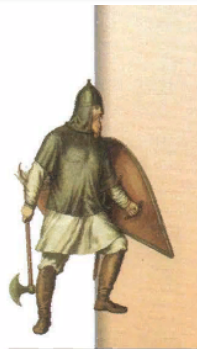
Русский пеший воин

Тем временем силу и популярность набирал второй сын Ярослава Мудрого — черниговский князь Святослав, сумевший отразить половецкий набег на свою землю. Он решил изгнать Изяслава с престола. В 1073 г. Святослав занял Киев, однако в 1076 г. он внезапно умер. Изяслав снова утвердился в Киеве. Его брат Всеволод, который по завещанию Перяяславль, стал правителем на Черниговскую ойную Святослава. В качестве полковника. На помощь поспешил киевский князь, но братья разбили войска в сражении погиб Изяслав. Ярославич (1078—1093). Святослав занял Киев по праву старшинства