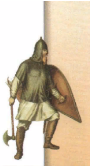
Русский пеший воин

Его брат Всеволод, который по завещанию получил Переяславль, стал прагматиком. Однако права на Черниговскую землю сына покойного Святослава. В качестве призыва отряды половцев. На помощь киевлянам поспешил киевский князь. Его дружины братьев разбили войска половцев. Но в сражении погиб Изяслав. Его преемником стал Всеволод Ярославич (1078—1093). Он занял киевский престол по праву старшинства в семье. Святослав и Всеволод совершили новый большой набег на Русь. Сын Святослава Олег, правивший вдалеке от Киева, против них выступило объединённое войско киевского князя и сына Всеволода Владимира Мономаха.