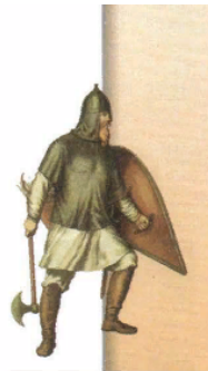
Русский пеший воин

Тем временем силу и популярность набирал второй сын Ярослава Мудрого — черниговский князь Святослав, сумевший отразить половецкий набег на свою землю. Он решил изгнать Изяслава с престола. В 1073 г. Святослав занял Киев, однако в 1076 г. он внезапно умер. Изяслав снова