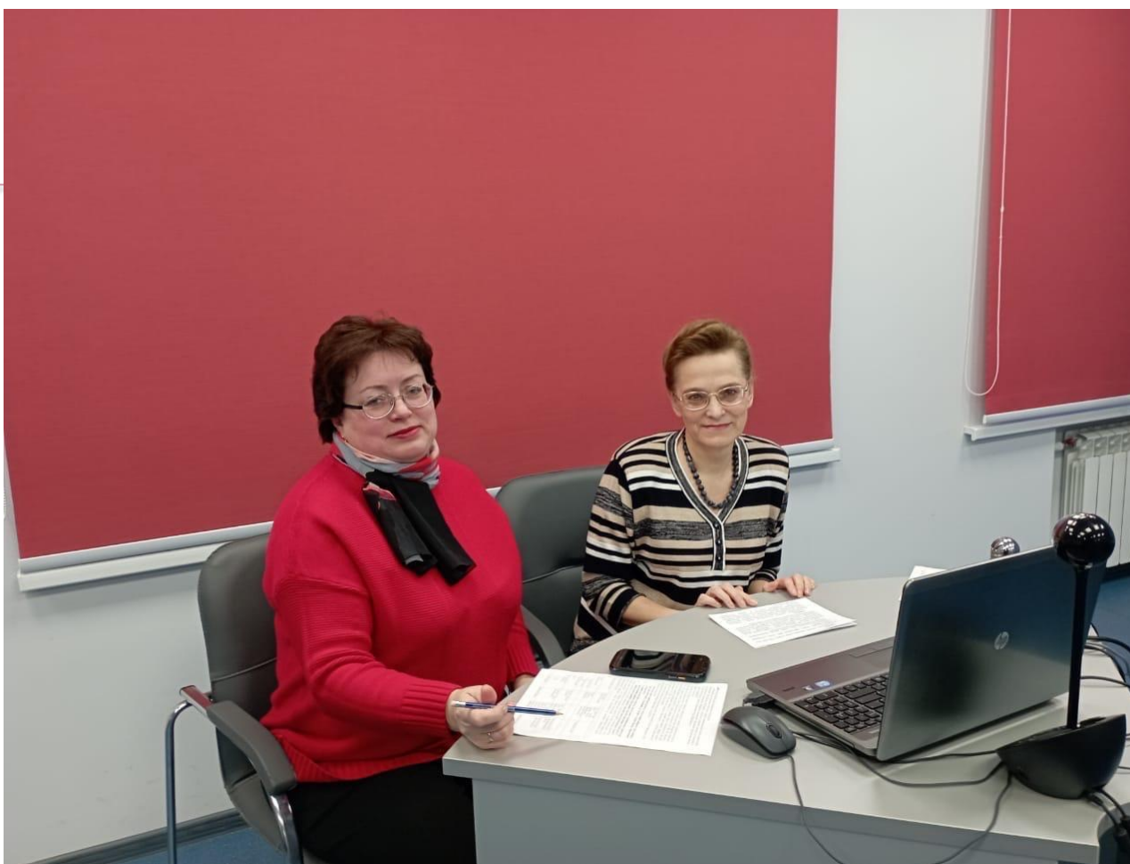
Межрегиональная научно-практическая конференция «Пространство образования и личностного развития: практики исследования и сотрудничества»