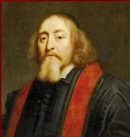
Ян Амос Коменский «Материнская школа»