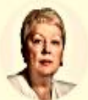
РУКОВОДИТЕЛЬ О. Ю. ВАСИЛЬЕВА Министр просвещения РФ