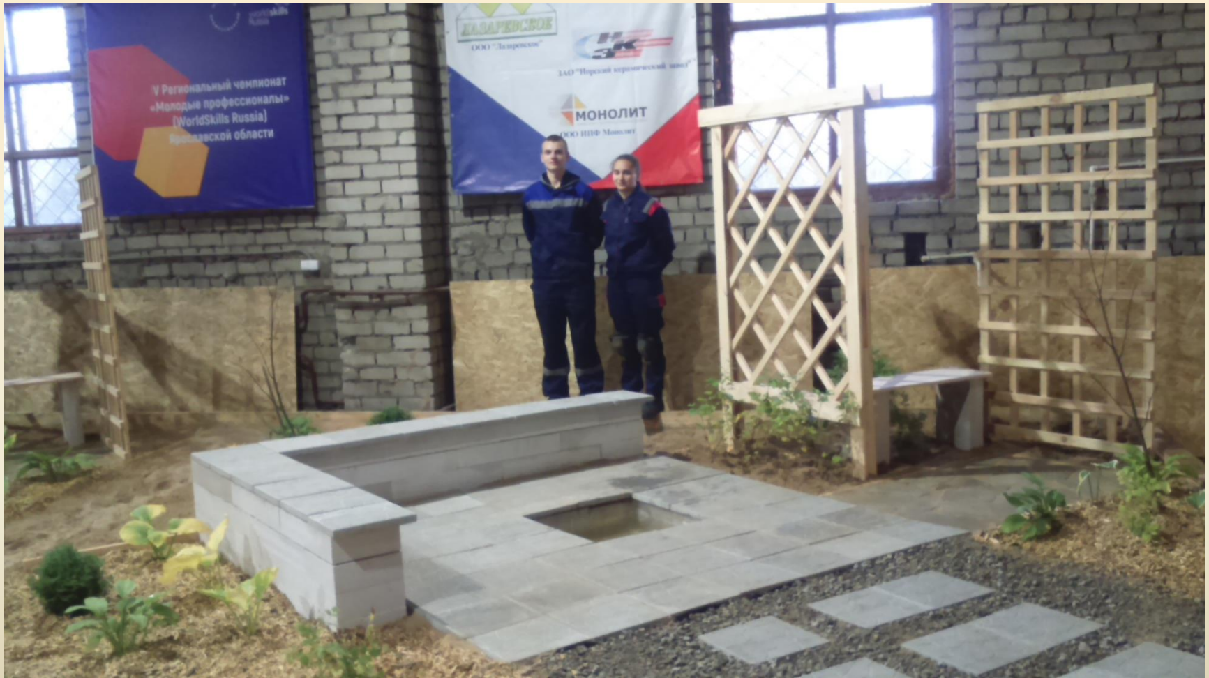
Конкурсное задание для компетенции «Ландшафтный дизайн», 2018г.