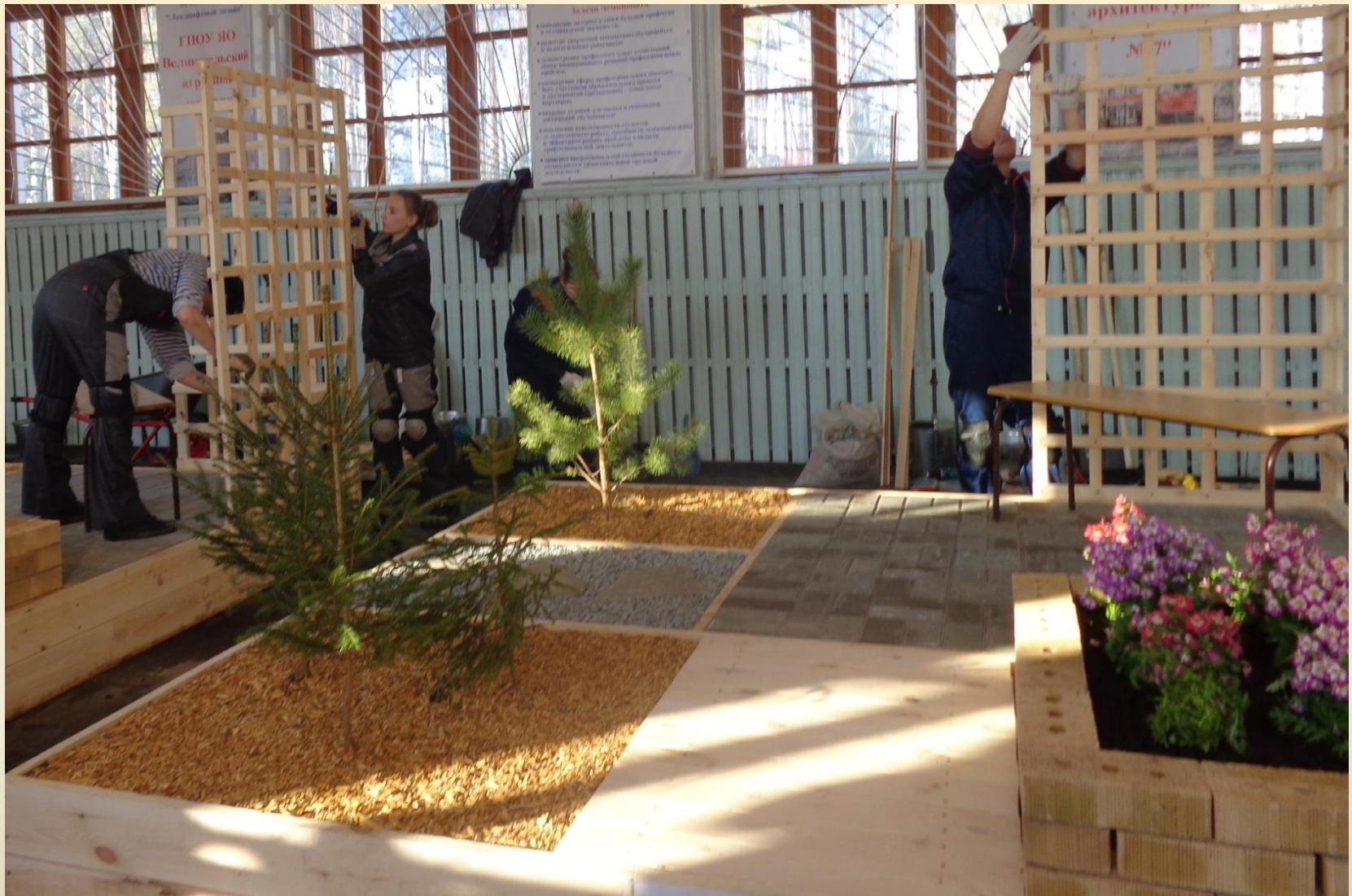
Посадка растений, установка малых архитектурных форм (пергола, скамейка)