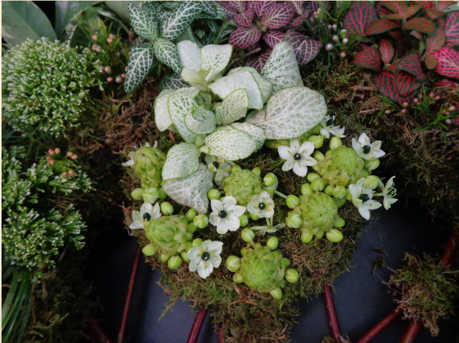
Фиттония, дерен белый (корнус), мох, суккуленты