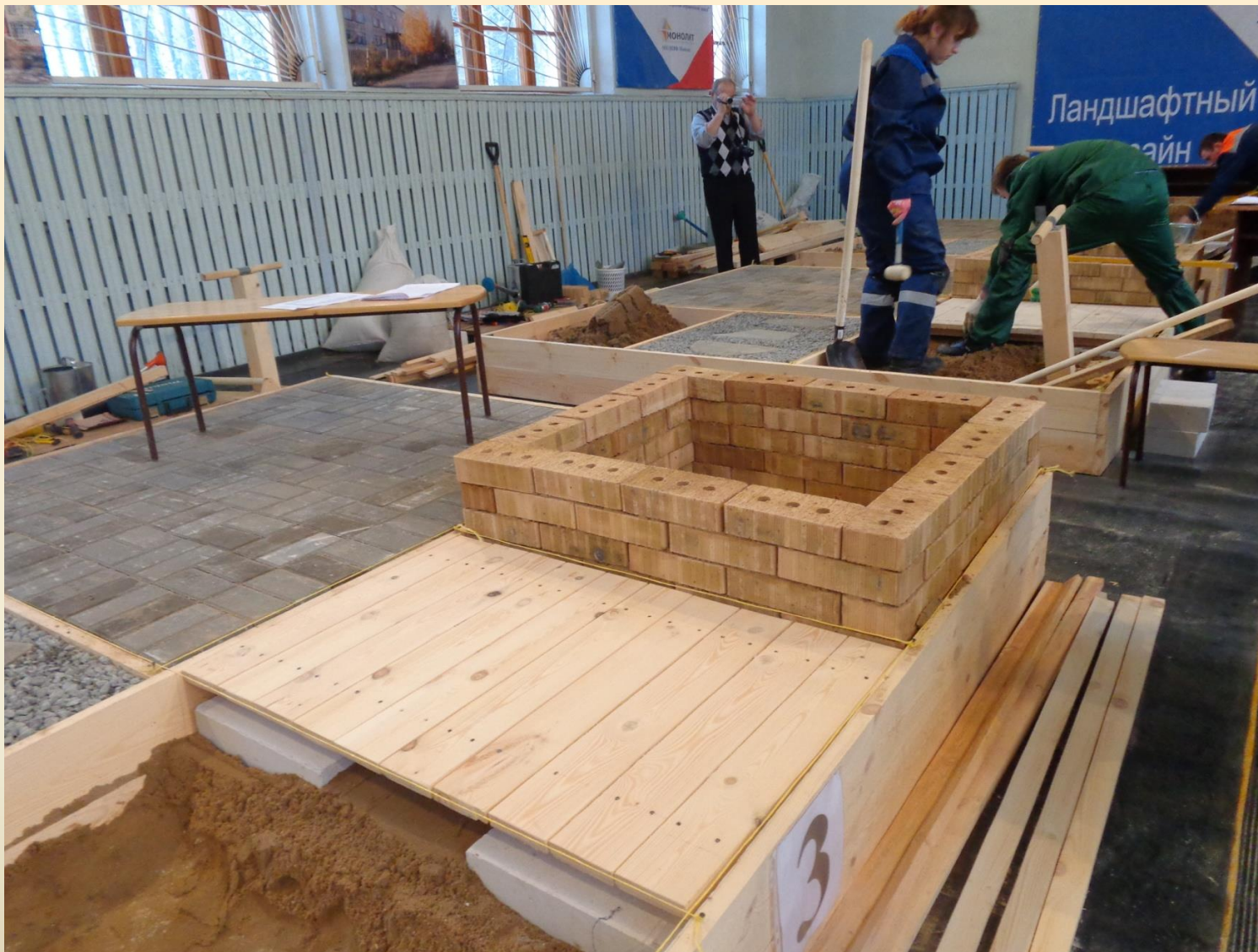
Настил из досок, подпорная стенка, укладка тротуарной плитки