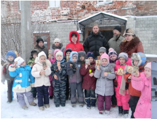
Экскурсия в Адрианов монастырь