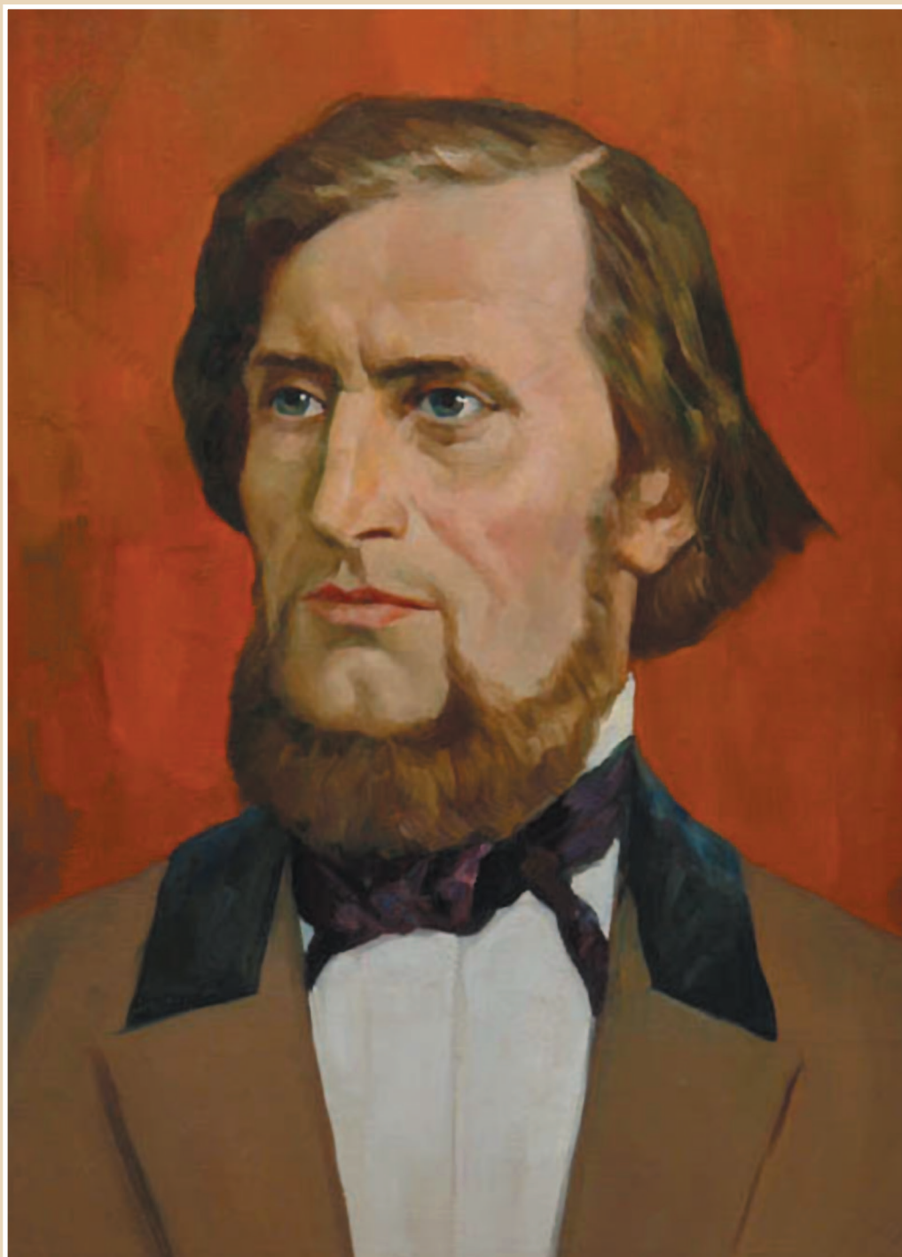
К. Д. Ушинский