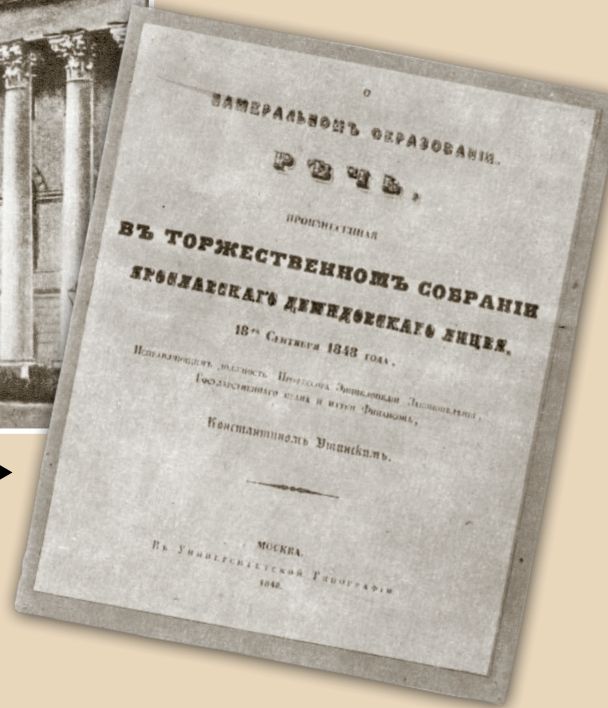
«О камеральном образовании» – речь К. Д. Ушинского на торжественном заседании студентов и преподавателей Ярославского лицея 18 сентября 1848 года. Издана в Москве в 1848 году.