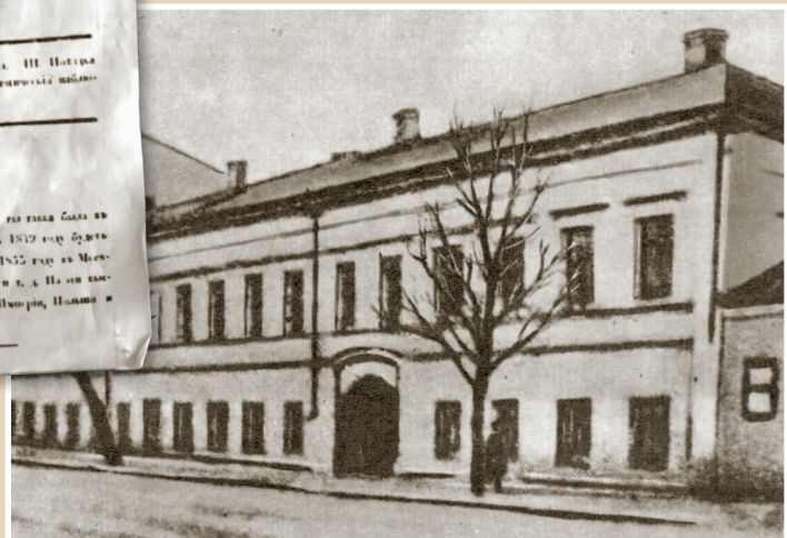
Дом в г. Ярославле, в котором жил К. Д. Ушинский (1846-1848)