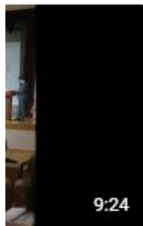
м" авская область назад