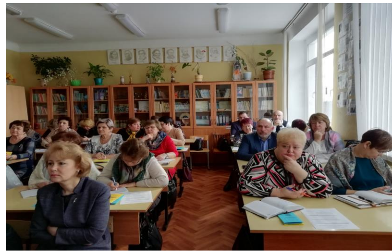
Семинар для директоров школ Ростовского МР