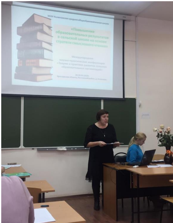
Международная конференция «Сельская школа»

Муниципальный ресурсный центр «Поддержка ШНОР и ШНСУ» 2021г.