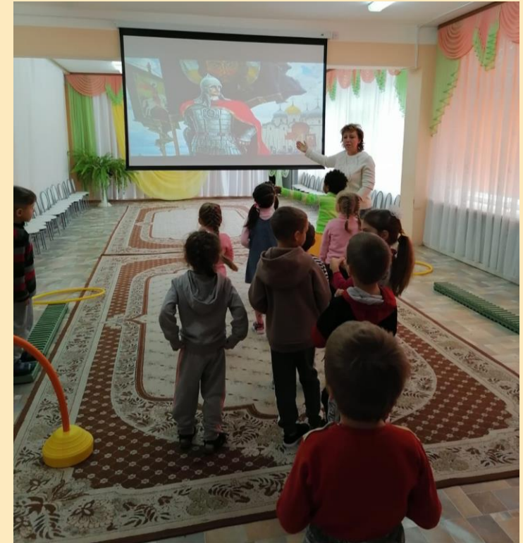
Интегрированное занятие «Александр Невский — великий полководец»