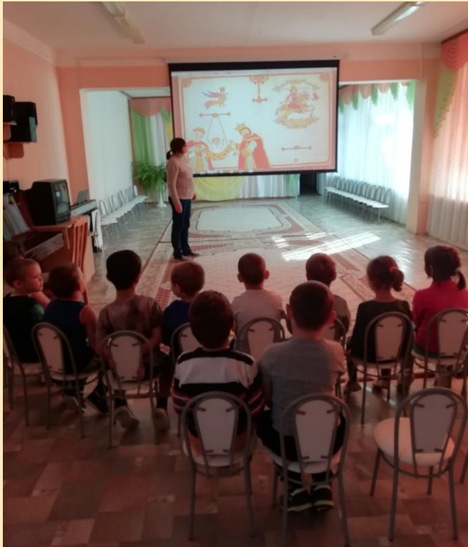
Просмотр учебного фильма «Александр Невский»