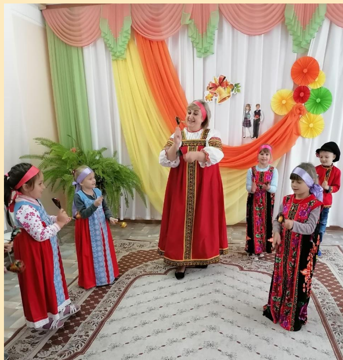
Оркестр «Весёлые ложки»