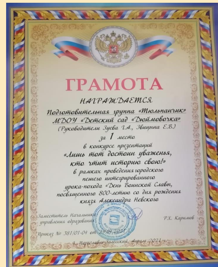
Конкурс презентаций «Лишь тот достоин уваженья, кто чтит историю свою»