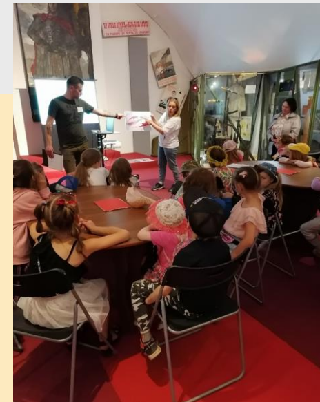
Встреча в зале боевой славы