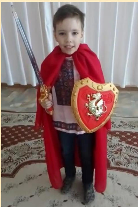
Чтение стихотворений об Александре Невском