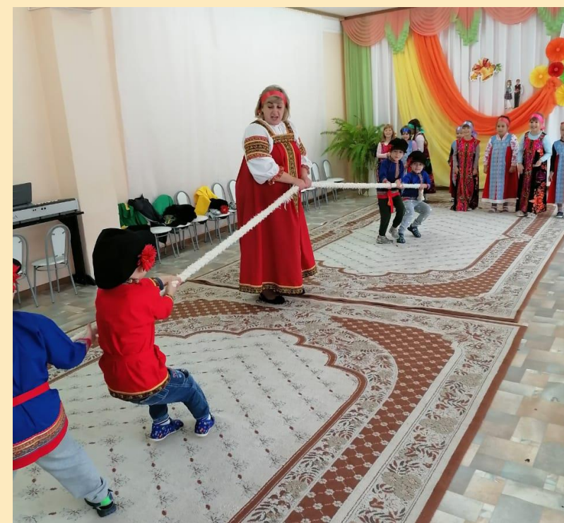
Игра «Русские забавы»