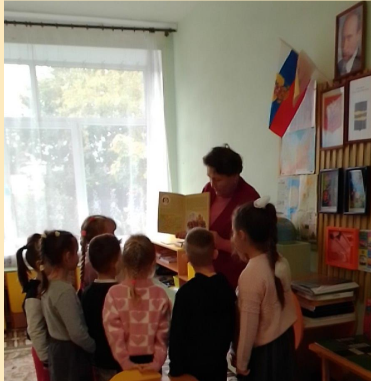
Беседа «Наш земляк Александр Невский»