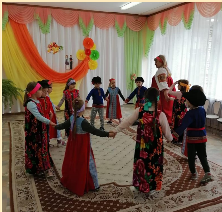
Хоровод «Пошла млада»