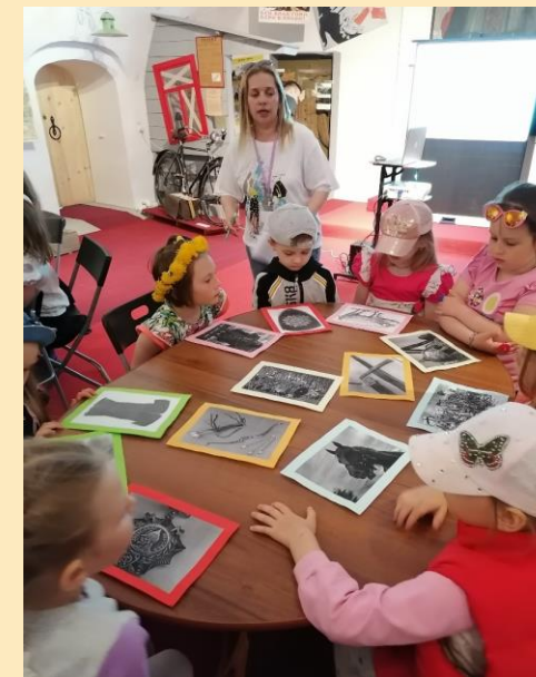
Доспехи Александра Невского