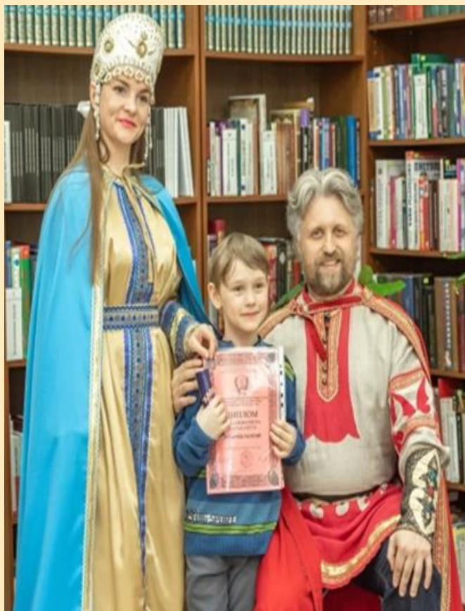
Онлайн конкурс чтецов «Александр Невский и Великая Русь»