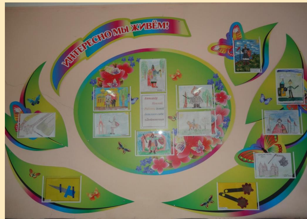
Выставка детского творчества «Имя России — Невский»