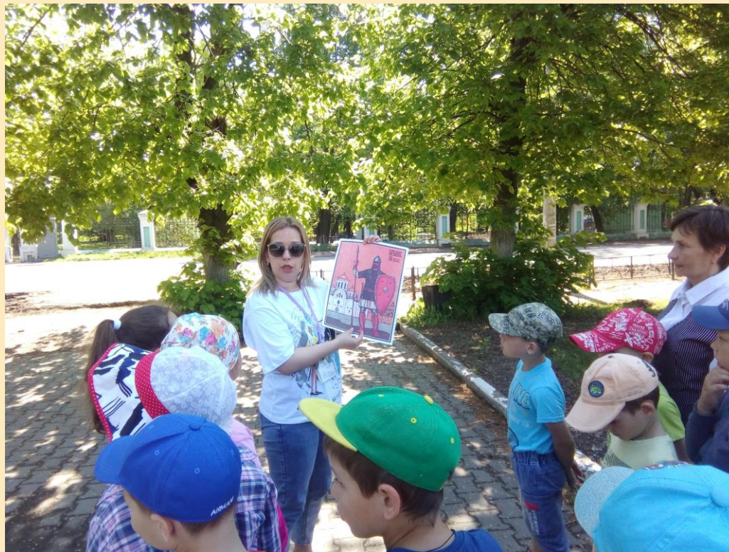
Городской интегрированный урок-поход