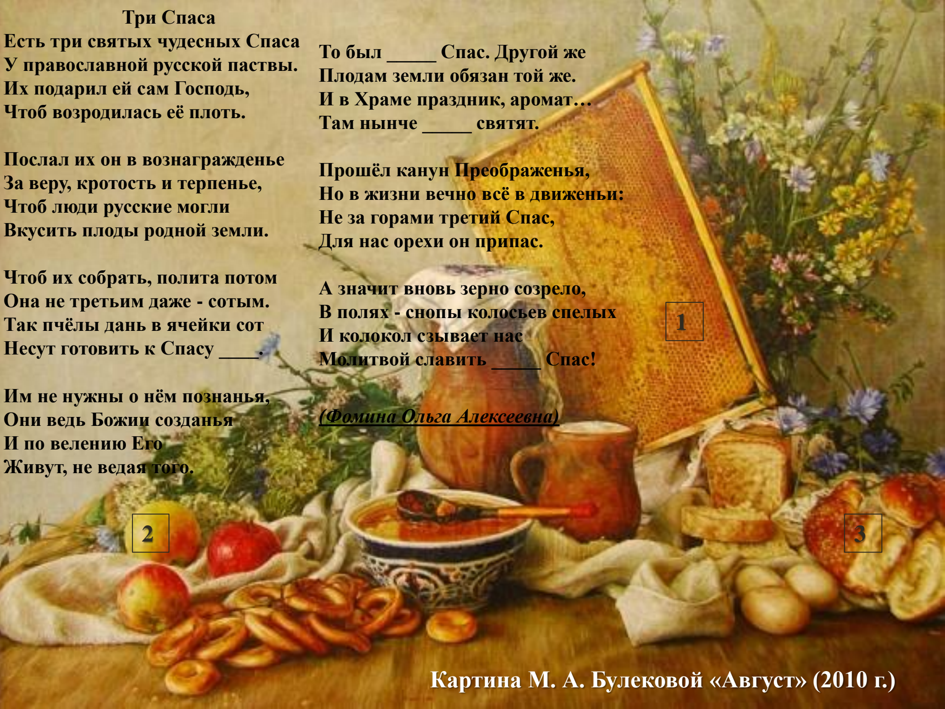
Картина М. А. Булековой «Август» (2010 г.)