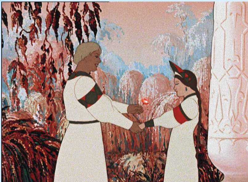
С.Т. Аксаков «Аленький цветочек»