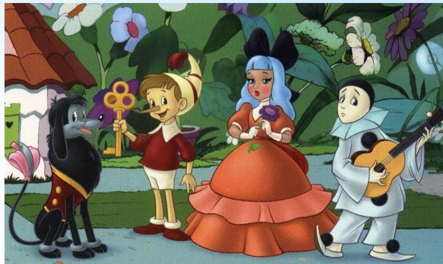
А.Н. Толстой «Приключения Буратино»