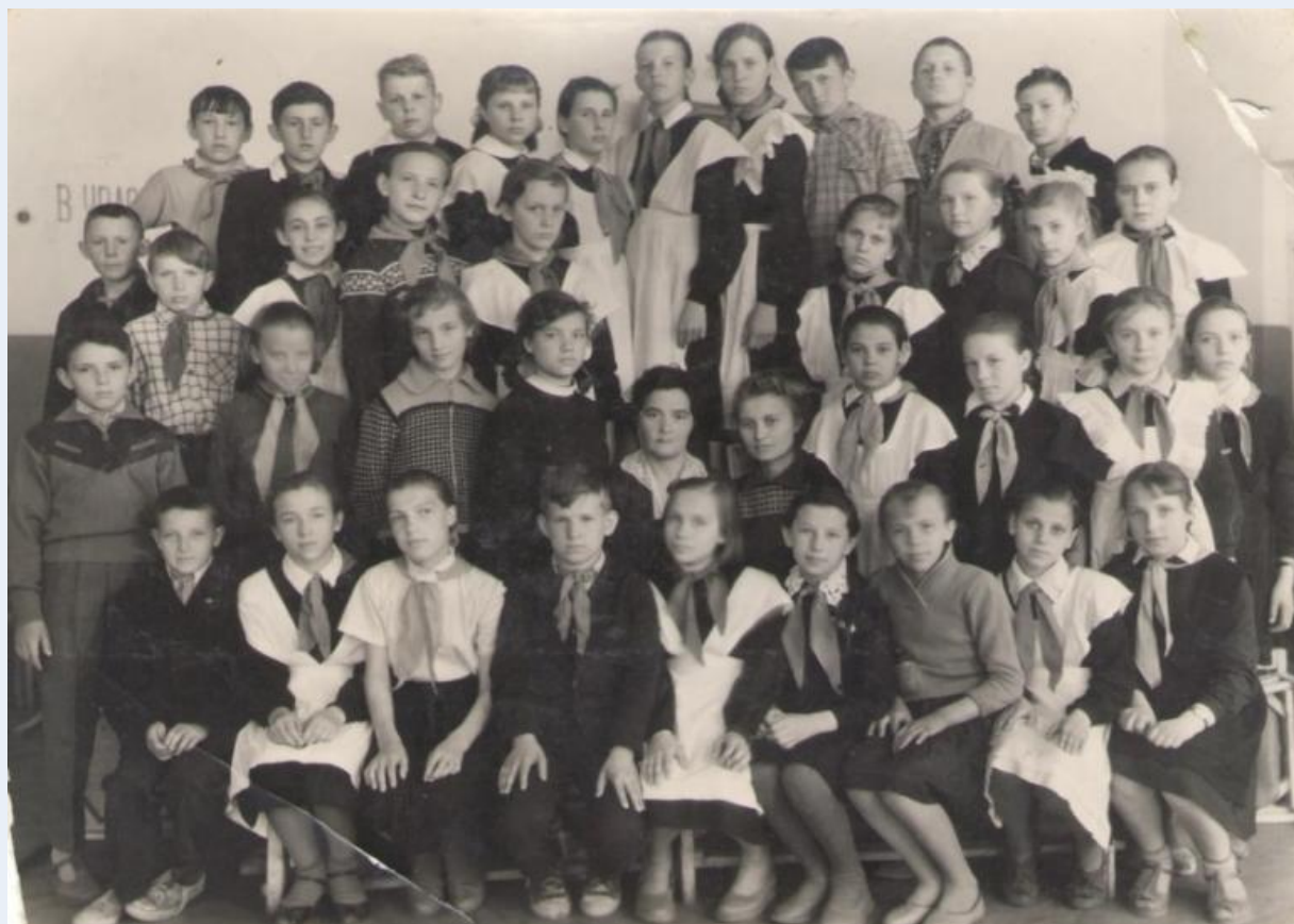
Школа № 123, 5 класс, май 1963 год

детей перевели туда. В этой школе никогда не ставили вопрос о ее национальности, не называли фашисткой, учителя относились к ней хорошо, появились друзья.