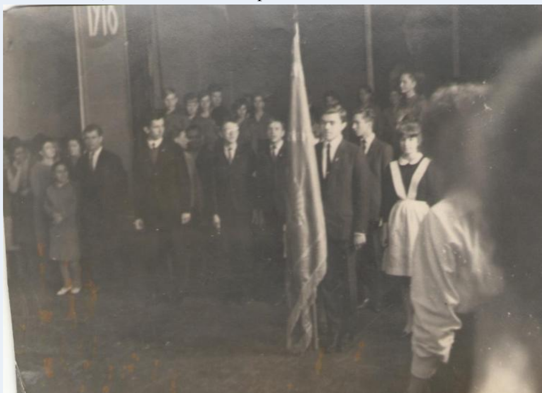
Торжественная линейка, посвященная дню рождения Комсомола, 9 класс, 1967 г.

Своим пробивным характером она добилась того, чтобы все раз и навсегда запомнили, что не все немцы фашисты!