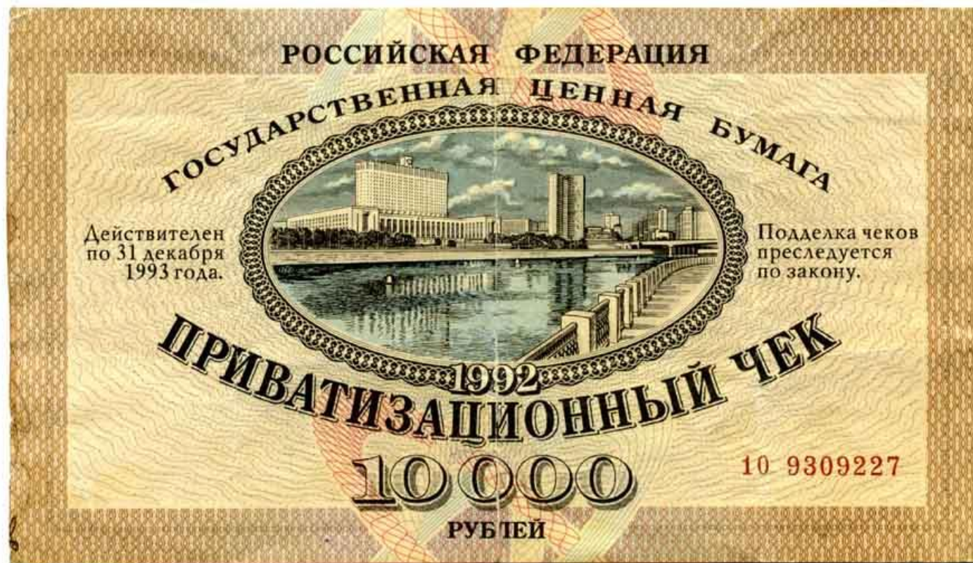
Приватизационный чек Российской Федерации