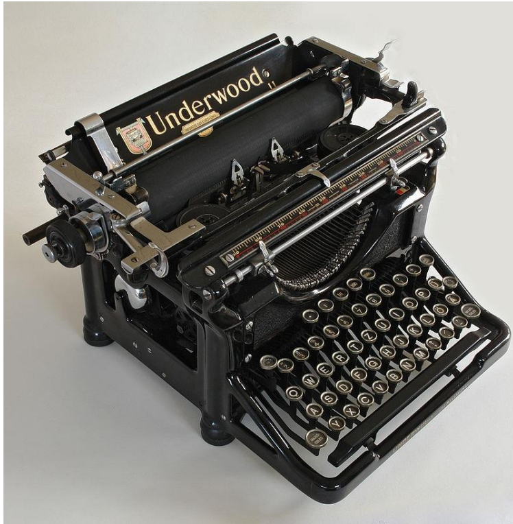
Пишущая машина «Ундервуд» (англ. Underwood), производившаяся с 1896 года, стала первой популярной машинкой с фронтальным расположением рычажно-литерной корзины