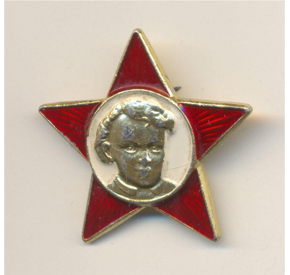
Значок октябрёнка (наиболее распространённая модель)