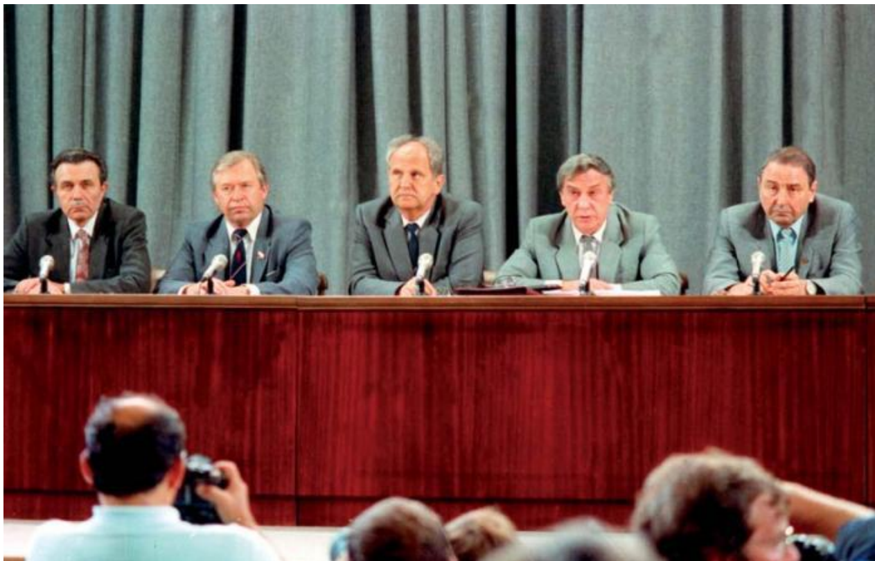
Пресс-конференция (ГКЧП) - Государственного комитета по чрезвычайному положению СССР, в здании МИД СССР 19 августа 1991 года. Слева направо: А.И. Тизяков, В.А. Стародубцев, Б.К. Пуго, Г.И. Янаев, О.Д. Бакланов.