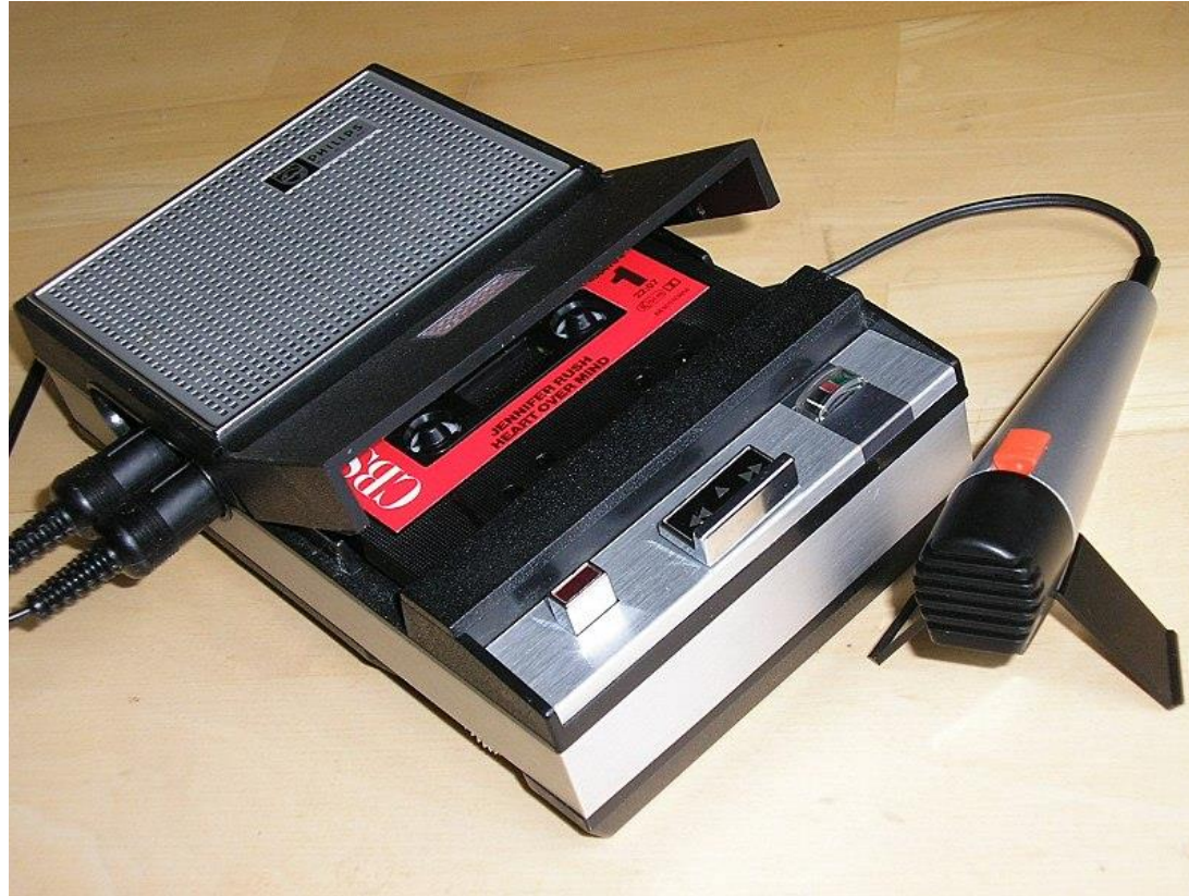
Кассетный диктофон Philips EL3302 (1968), внешне идентичный первому кассетному магнитофону Philips EL3300 (1963)