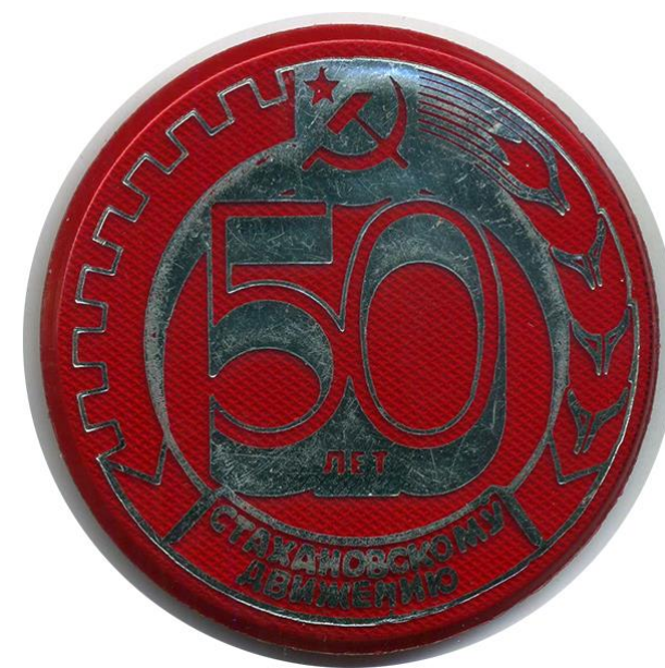
Значок «Стахановскому движению 50 лет»