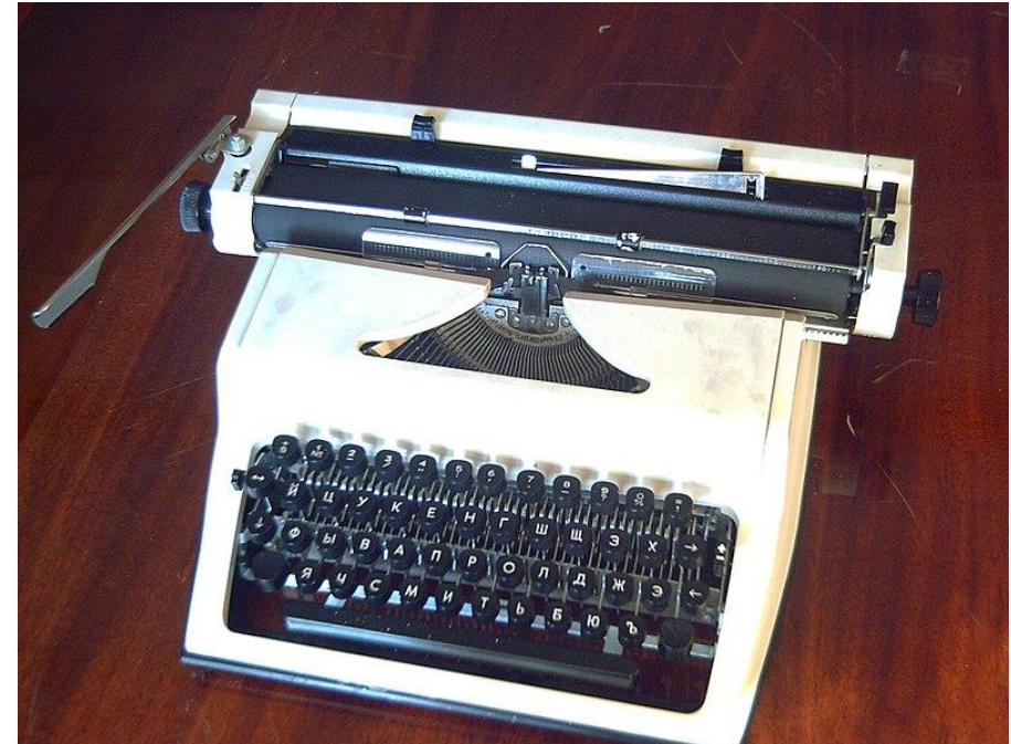
Пишущая машинка «Любава»