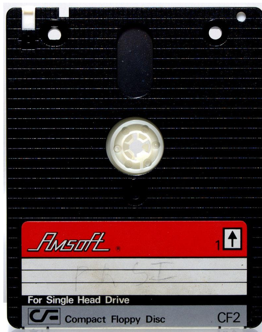
3-дюймовая дискета от Amsoft