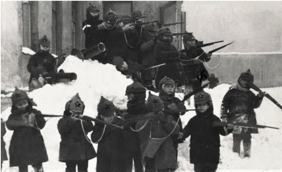
Октябрята — защитники Октября. 1930-е годы.