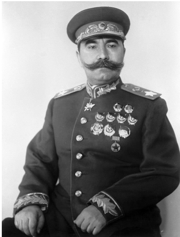
Маршал Советского Союза Семён Михайлович Будённый в парадной форме образца 1943 года.