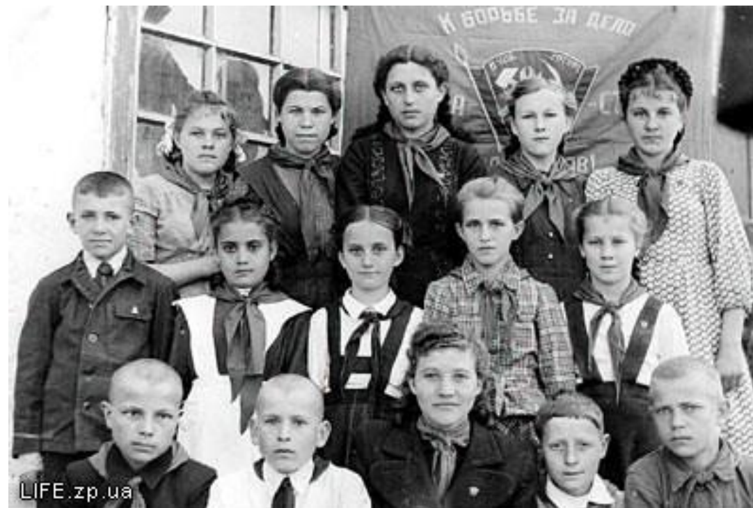
Совет пионерской дружины имени Матросова, 1949 год