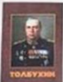
Федор Иванович Толбухин , маршал Советского Союза, Герой Советского Союза; фотоматериал в 128-летие со дня рождения. - Ярославль, 2018.

Федор Иванович Толбухин , маршал Советского Союза, Герой Советского Союза; фотоматериал в 128-летие со дня рождения. - Ярославль, 2018. 131 с. фотоматериалы. В книгу собраны иллюстрации и фотоматериалы, которые описывают жизненный путь участника Гражданской войны, Гражданской и Великой Отечественной войны Федора Ивановича Толбухина (1904-1949). В книгу представлены все армия и военно-морская, кадровые фото материалы, установленные ему званиями. Также включены собраны серия фотографий Федора Толбухина, сделанные в 1945 году в составе 3-го Украинского фронта фотокорреспондентов страны: образцы звезды Огней Давыда Мосоловской войны; представленные рисунки, окладные образцы маршала в кино, фотоматериалы и аудиозаписи, его рождение и др.